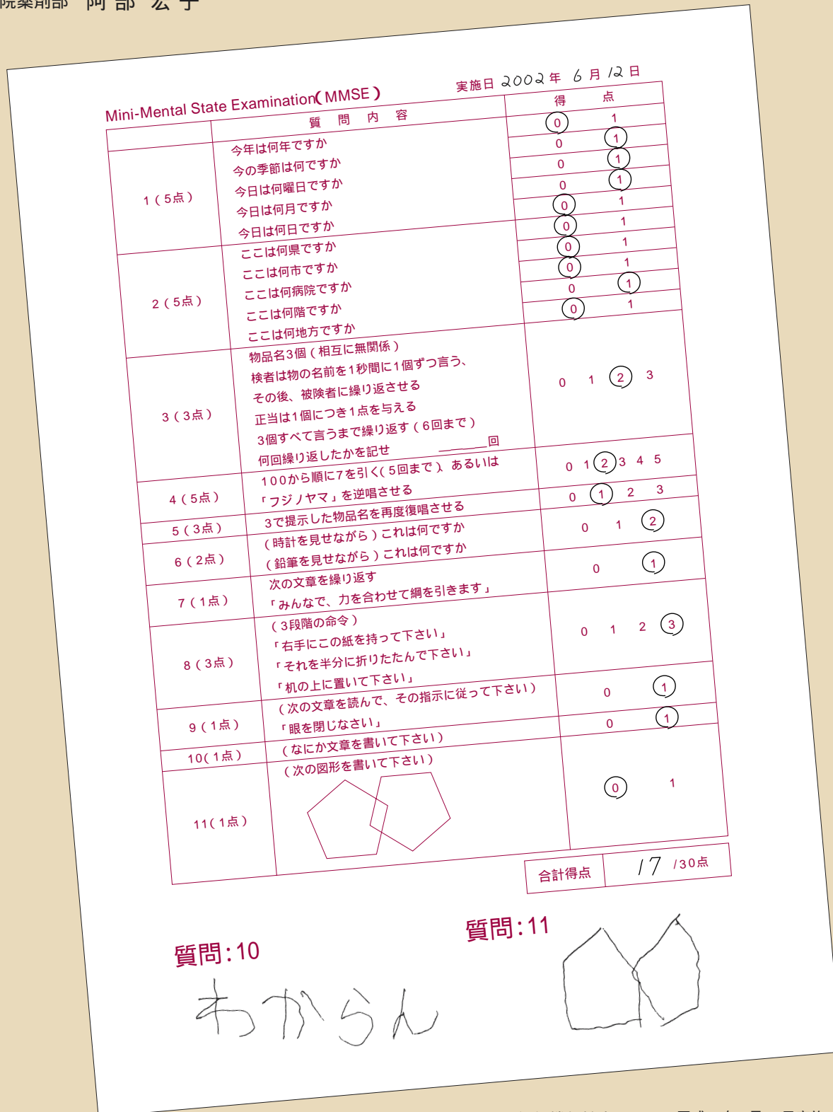
図1 認知機能検査MMSE(平成14年6月12日実施)