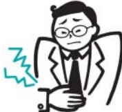
急に起きたつらい胃痛