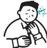
二日酔いのはきけ・むかつき