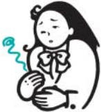
胃のむかつきや不快感

サクロンQは、胃酸やアルコールなどが胃粘膜を刺激して起きる「ムカムカ・はきけ・胃痛」に速く効く胃ぐすりです。成分(オキセサゼイン)が胃粘膜に直接作用し、つらい症状を改善します。